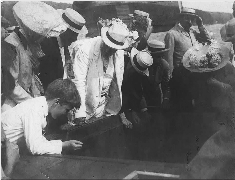
Президент Теодор Рузвельт оглядає корабель «Рузвельт» перед відплиттям до Північного полюса, 1908 рік

«Рузвельт» зупинився в Нью-Бедфорді, щоб завантажити вельботи 1 , а також зробив коротку зупинку біля острова Ігл, де на узбережжі штату Мен стояв наш літній будиночок. Там ми повантажили на борт масивне, обковане сталлю запасне кермо — запобіжний захід, якщо зіткнемося з труднощами в боротьбі з льодом. У попередній експедиції траплялися моменти, коли знадобилося б два керма, але ми взяли тільки одне. Натомість цього разу на борту лежало додаткове, але нагоди ним скористатися так і не трапилося.